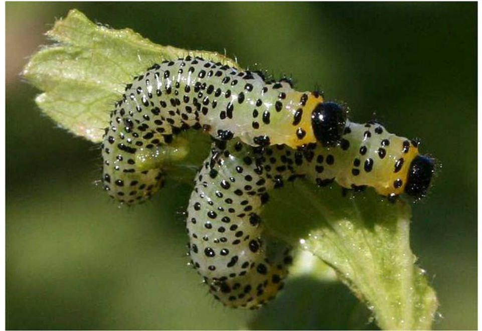
Kollase karusmarja-lehevaablase ebarööviku