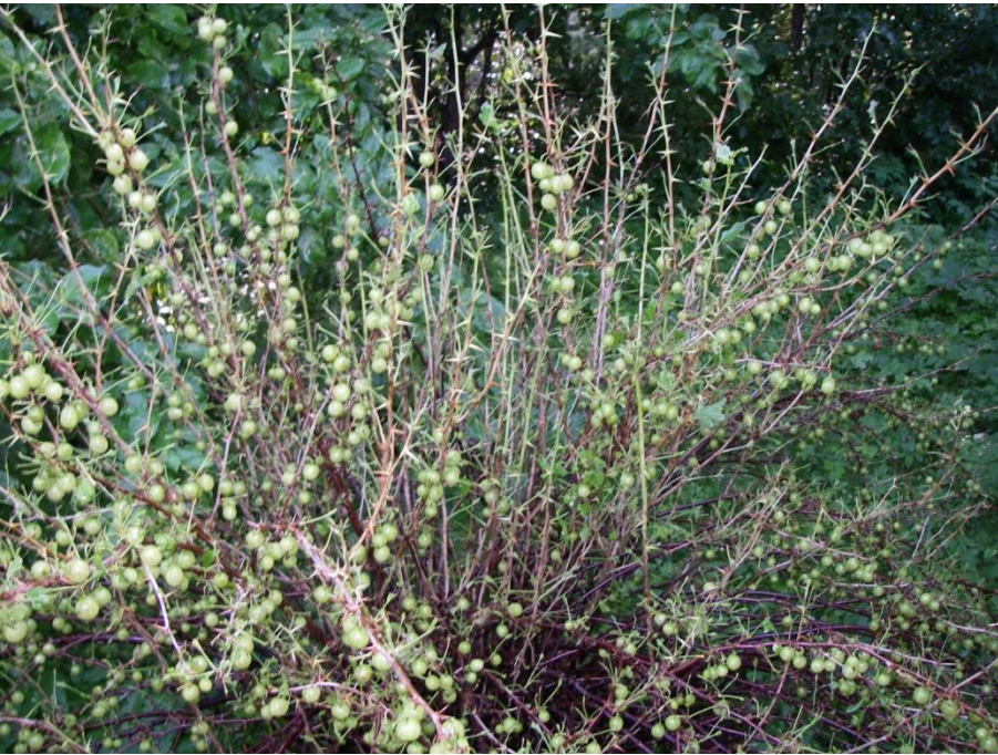
Tikripõõsal polegi enam lehti